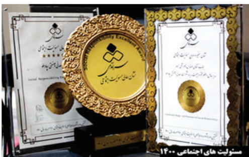
مسؤولیت های اجتماعی ۱۴۰۰