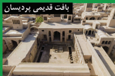
بافت قدیمی پردیسان