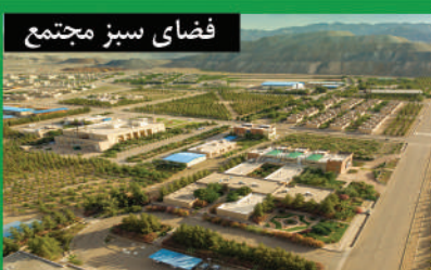
فضای سبز مجتمع