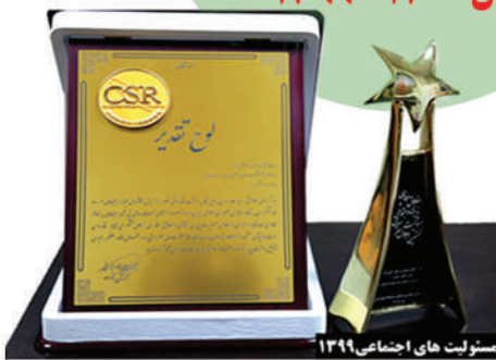
مسؤولیت های اجتماعی ۱۳۹۹

دریافت نشان برتر مسؤولیت اجتماعی سال ۱۳۹۹-۱۴۰۰