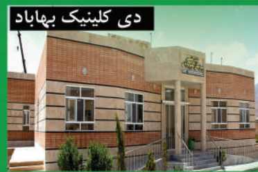
دی کلینیک بهاباد